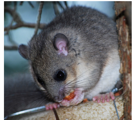
Popielica szara jedząca orzecha laskowego.